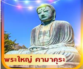
พระใหญ่ คามาคุระ