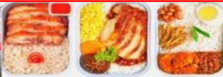
บริการอาหารร้อน ทั้งขาไป-ขากลับ