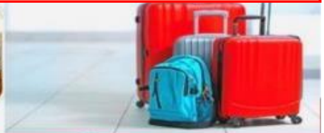
น้ำหนักกระเป๋า สูงสุด 20 กก.