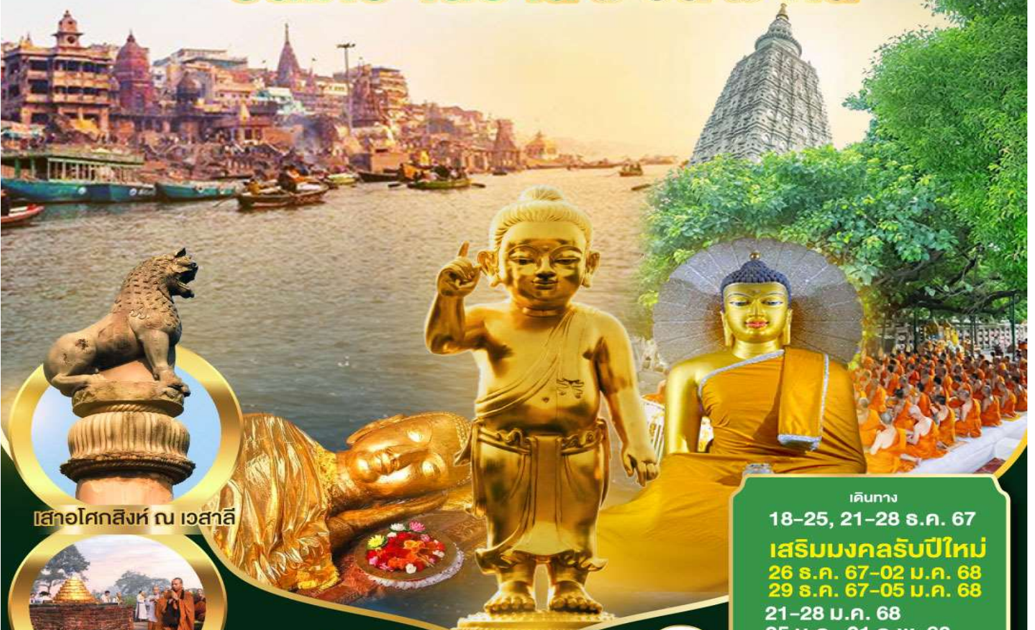
เสาอโศกสิงห์ ณ เวสาลี