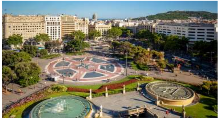
นำท่านเก็บภาพบริเวณด้านหน้า คา

หลังอาหารเช้าชมความงามของเมืองบาร์เซโลนา บนยอดเขา “มงต์จูลิก” Mont Juic จากนั้นเข้าสู่ จัตุรัสคาตาลุนญา ( Plaça Catalunya ) จัตุรัสที่มีชีวิตชีวาแห่งนี้ เป็นหัวใจของบาร์เซโลนา จัตุรัสแห่งนี้เปิดโดยกษัตริย์อัลฟองโซ่ที่ 13 ในปี 1927 พื้นที่นี้เคยเป็นที่ดินเปล่าที่ตั้งอยู่หน้าประตูเมืองที่มีกำแพงล้อมรอบ ปัจจุบันมีศูนย์การค้าและห้างสรรพสินค้าขนาดใหญ่ และรายล้อมไปด้วยร้านค้า ร้านอาหารมากมาย