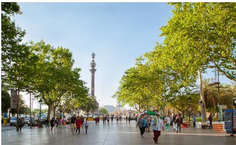
GO3LIS-EK004 Portual-Spain 10D7-EK

จากนั้นนำท่านเดินทางสู่ สนามคัมป์นู (Camp Nou) สนามฟุตบอลของสโมสรบาร์เซโลน่า ที่มีขนาดใหญ่ที่สุด โดยมีความจุผู้เข้าชมได้ถึงเกือบ 99,000 คน ให้ท่านได้ถ่ายรูปด้านนอก พร้อมทั้งเลือกซื้อของที่ MEGA STORE ของทีมบาร์เซโลน่า นำท่านขึ้นสู่จุดชมวิวของเมืองที่ เนินเขามองต์คูอิก (Montjuïc) เป็นเนินเขาในบาร์เซโลน่าที่มีทัศนียภาพอันงดงาม ทางด้านตะวันออกของเนินเขายังมีหน้าผาสูงชันซึ่งทำหน้าที่เป็นดั่งกำแพงเมือง ส่วนด้านบนเป็นที่ตั้งของป้อมปราการหลายแห่ง จากนั้นให้ท่านอิสระเดินเล่นบริเวณ ถนน ลา รัมบลาส (La Ramblas) ถือเป็นถนนชื่อดังของเมืองบาร์เซโลน่า นอกจากจะสะอาดสะอ้านและมีต้นไม้คอยสร้างความร่มรื่นให้ตลอดทางแล้ว ยังมีร้านค้ามากมาย โดยที่ปลายสุดของถนนสายนี้เป็นที่ตั้งของอนุสาวรีย์คริสโตเฟอร์ โคลัมบัส Christopher Columbus ผู้ค้นพบทวีปอเมริกาในปี ค.ศ.1492 อิสระให้ท่านเดินเล่นและช้อปปิ้งตามอัธยาศัย