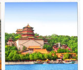
พระราชวังฤดูร้อน อวิเหอหยวน