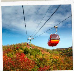
กำแพงเมืองจีน ด่านมู่เถียนยวี