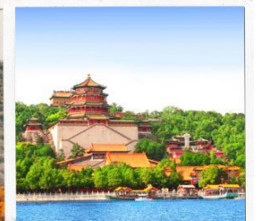
พระราชวังฤดูร้อน อวิเหอหยวน