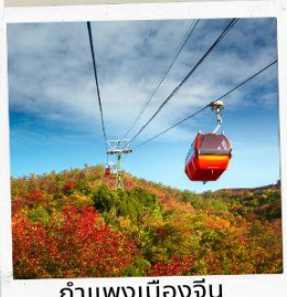
กำแพงเมืองจีน ด้านมู่เถียนยวี่