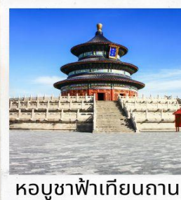
หอบูชาฟ้าเทียนถาน