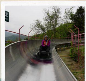
ลงสไลด์เดอร์, ด้านมู่เถียนยวี่