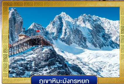
กุเวาหิมะมังกรหยก