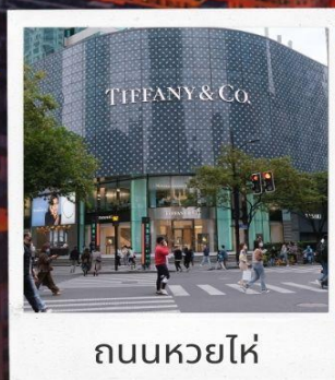
ถนนหวยไห่