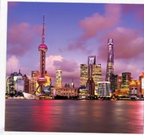
ชั้นหอไข่มุก