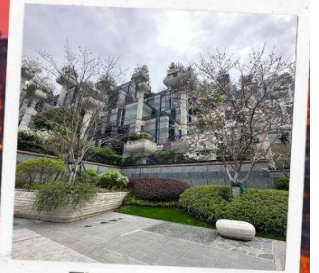
Tian An 1,000 Trees Square