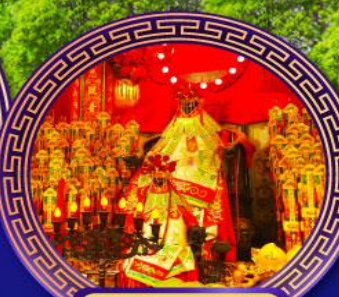
วัดเจ้าแม่กวนอิม ช่องฮ่า