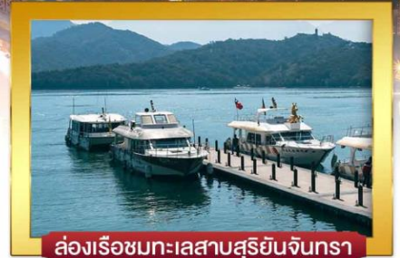
ล่องเรือชมทะเลสาบสุริยอันจินตรา