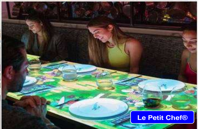
Le Petit Chef®