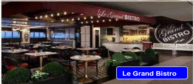
Le Grand Bistro