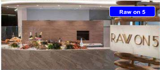
Raw on 5