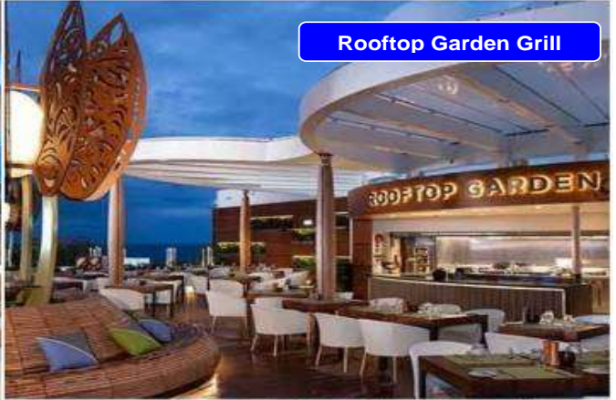
Rooftop Garden Grill