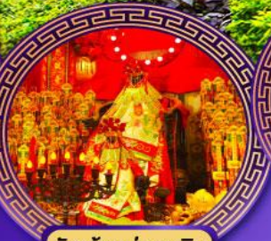
วัดเจ้าแม่กวนอิม ฮ่องง่า