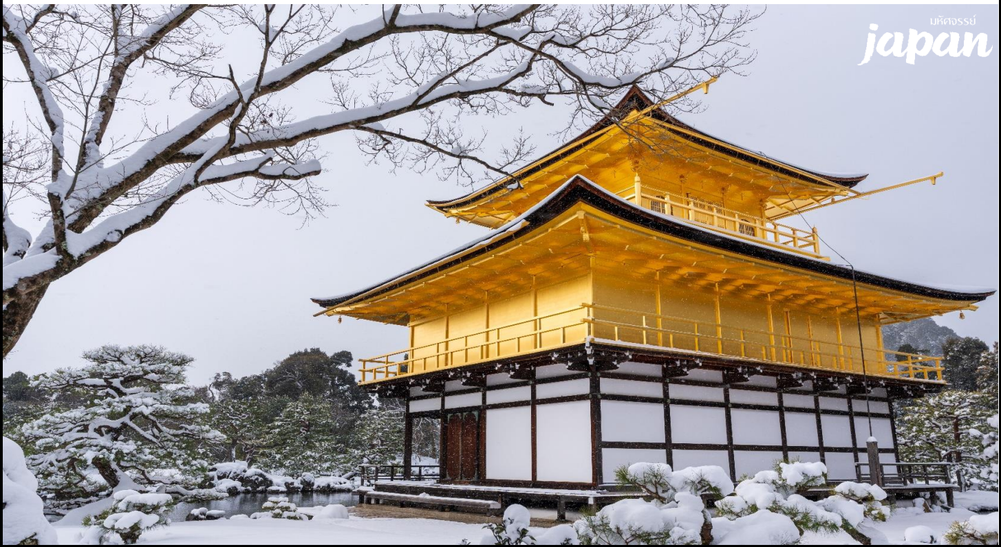
มหัศจรรย์ japan

นำท่านสู่ วัดคินคะคุจิ หรือ ที่เรียกกันว่าวัดทอง จุดเด่นของวัดนี้คือตัวอาคารหลักมีสีทองเหลืองอร่าม ตั้งโดดเด่นเป็นสง่าอยู่ท่ามกลางน้ำ เวลามองภาพสะท้อนจากน้ำจะเห็นภาพที่งดงามเป็นอย่างมาก กลายเป็นสัญลักษณ์แห่งหนึ่งของเมืองเกียวโต และจากการที่มีสถาปัตยกรรมที่โดดเด่นและงดงาม ทำให้ได้รับการขึ้นทะเบียนเป็นมรดกโลกจากยูเนสโก ในปี ค.ศ. 1994 เดิมทีถูกสร้างขึ้นมาเพื่อเป็นที่พำนักของท่านโชกุน อาชิกาก่า โยชิมิสึ และไว้รับรองแขกกระตือรือร้นอีกด้วย ภายหลังเสียชีวิตก็มีการยกที่พักแห่งนี้กลายมาเป็นวัดในนิกายเซน และกลายมาเป็นวัดคินคะคุจิในปัจจุบัน (รวมค่าเข้าชม)