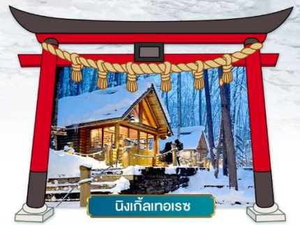
นิงเกิลเทอเรซ