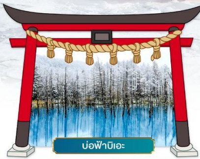
บ่อน้ำบิเอะ

☑ ชมความสวยงามท่ามกลางหิมะ ณ หมู่บ้านเทพนิยาย นิงเกิลเทอเรซ