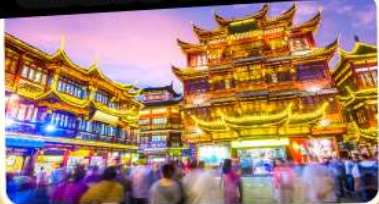
ตลาดร้อยปีเจียงหวงเมี่ยว