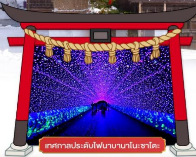
เทศกาลประดับไฟนากาโนะ ซาโตะ