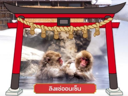
ลิงแช่ออนเซ็น

เดินทางโดยสารการบิน : ไทยแอร์เอเชียเอ็กซ์