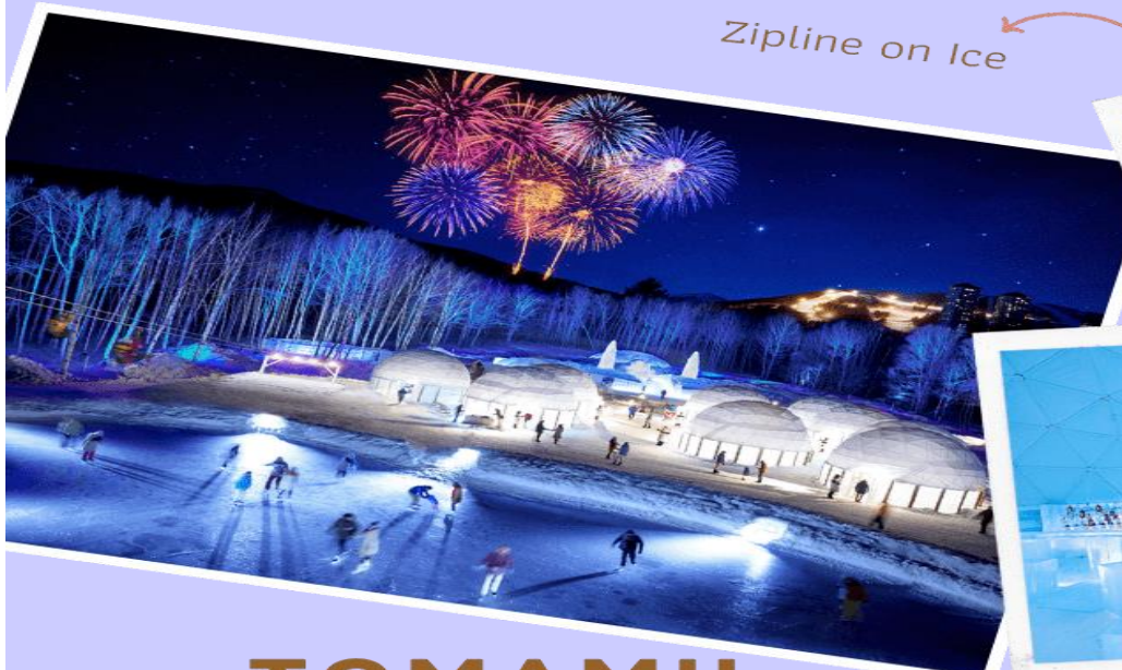
Zipline on Ice

หลังรับประทานอาหารกลางวัน นำท่านเดินทางสู่ TOMAMU ICE VILLAGE ซึ่งตั้งอยู่ใน โอชิโนะริสอร์ทโทมามุ ( Hoshino Resort Tomamu ) เป็นหมู่บ้านชั่วคราวที่สร้างขึ้นจากการแกะสลักน้ำแข็งในช่วงฤดูหนาวเท่านั้น บ้านน้ำแข็งแต่ละหลังมีการประดับประดาแสงไฟสีสันต่างๆ ให้งดงามมากยิ่งขึ้น นอกจากนี้ให้ การเก็บภาพความสวยงามของบ้านน้ำแข็งแล้วยังมีกิจกรรมอื่นๆ อีกมากมาย เช่น Zipline on Ice จะเคลื่อนตัวลงมาเป็นระยะทางประมาณ 60 เมตร ระหว่างทางคุณจะได้ชื่นชมทิวทัศน์ของหิมะ และลานน้ำแข็งที่น่าอัศจรรย์ Ice Bakery & Cafe คาเฟ่ที่ให้บริการเครื่องดื่มร้อน และขนม ที่ให้ท่านนั่งทานบนโต๊ะ และเก้าอี้น้ำแข็ง Ice Bar บาร์ที่บริการเครื่องดื่มประเภทค็อกเทล และเครื่องดื่มแอลกอฮอล์อื่นๆ หลายชนิด ที่เสิร์ฟในแก้วน้ำแข็งสวยๆ เป็นต้น (**ราคาทัวร์ไม่รวมค่ากิจกรรมและค่าเครื่องดื่ม Ice Bar, Ice Bakery & Cafe**)