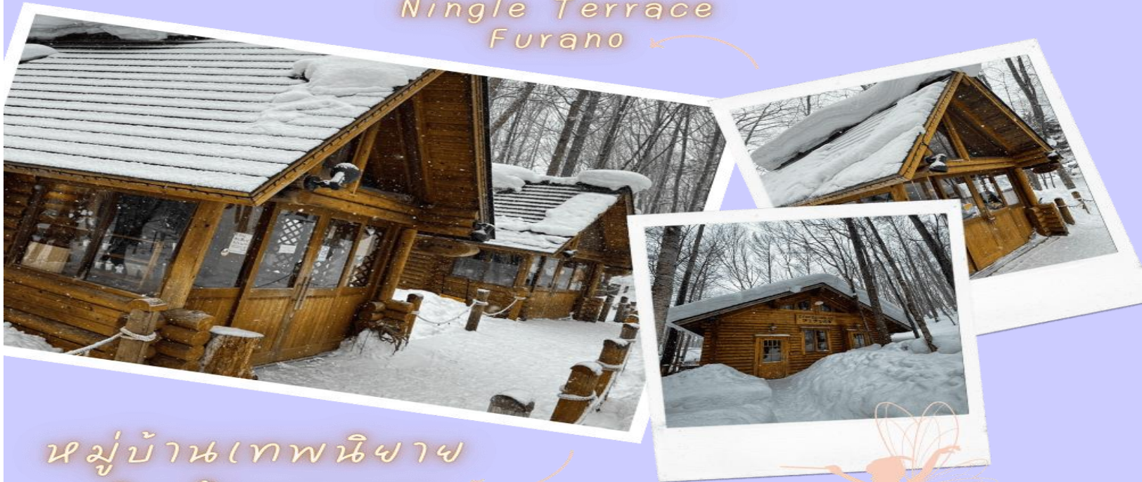
หมู่บ้านเทพนิยาย นิงเกิ้ลเทอเรส