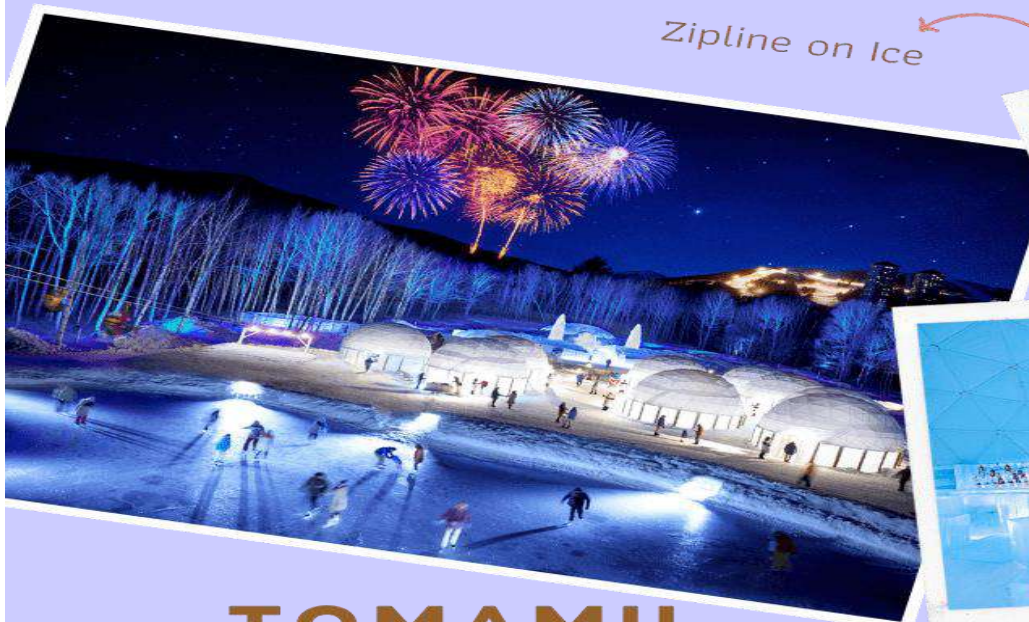
Zipline on Ice

หลังรับประทานอาหารกลางวัน นำท่านเดินทางสู่ TOMAMU ICE VILLAGE ซึ่งตั้งอยู่ใน โอชิโนะริรีสอร์ททโทมามุ ( Hoshino Resort Tomamu ) เป็นหมู่บ้านชั่วคราวที่สร้างขึ้นจากการแกะสลักน้ำแข็งในช่วงฤดูหนาวเท่านั้น บ้านน้ำแข็งแต่ละหลังมีการประดับประดาแสงไฟสีสันต่าง ๆ ให้งดงามมากยิ่งขึ้น นอกจากนี้ให้ การเก็บภาพความสวยงามของบ้านน้ำแข็งแล้วยังมีกิจกรรมอื่น ๆ อีกมากมาย เช่น Zipline on Ice จะเคลื่อนตัวลงมาเป็นระยะทางประมาณ 60 เมตร ระหว่างทางคุณจะได้ชื่นชมทิวทัศน์ของหิมะ และลานน้ำแข็งที่น่าอัศจรรย์ Ice Bakery & Cafe คาเฟ่ที่ให้บริการเครื่องดื่มร้อน และขนม ที่ให้ท่านนั่งทานบนโต๊ะ และเก้าอี้น้ำแข็ง Ice Bar บาร์ที่บริการเครื่องดื่มประเภทค็อกเทล และเครื่องดื่มแอลกอฮอล์อื่น ๆ หลายชนิด ที่เสิร์ฟในแก้วน้ำแข็งสวย ๆ เป็นต้น (**ราคาทัวร์ไม่รวมค่ากิจกรรมและค่าเครื่องดื่ม Ice Bar, Ice Bakery & Cafe**)