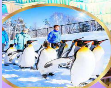
สวนสัตว์ อาซาฮิยาม่า