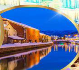
คลองโอดารุ