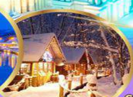
หมู่บ้านเทพนิยาย นิงเกิลเทอเรส