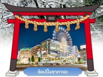
ช้อปปิ้งซาคาเอะ