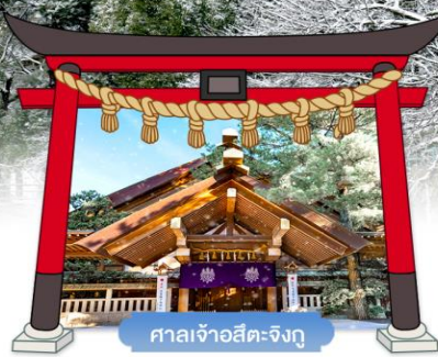
ศาลเจ้าอิตะจิงุ