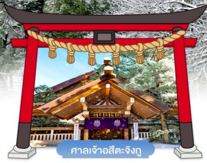
ศาลเจ้าอัสตะจิงกู