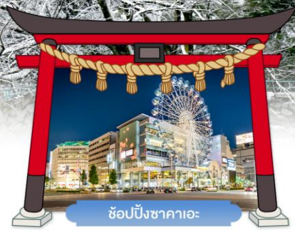
ช้อปปิ้งซาคาเอะ

เดินทางโดยสายการบินแอร์เอเชียเอ็กซ์ อาหาร : 6 มื้อ โรงแรม : 3 คาว