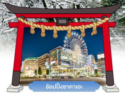
ช้อปปิ้งซากาเอะ