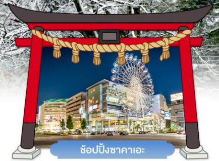
ช้อปปิ้งซากาเอะ