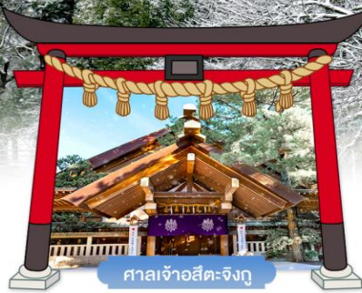
ศาลเจ้าอิตะจิงุ