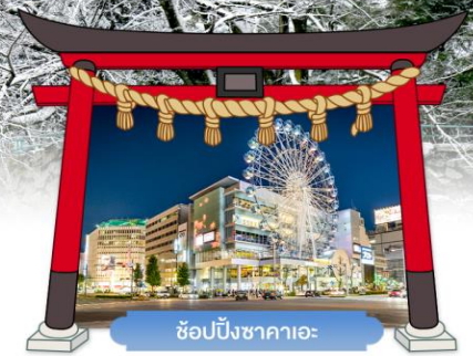
ช้อปปิ้งซากาเอะ