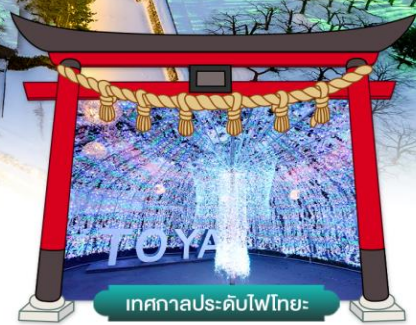
เทศกาลประดับไฟไทยะ