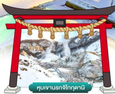
หุบเขานรกจิโกกุคานี