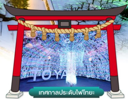
เทศกาลประดับไฟไทยะ