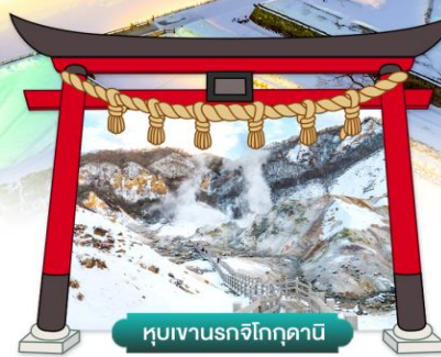
หุบเขานรกจิโกกุคานี