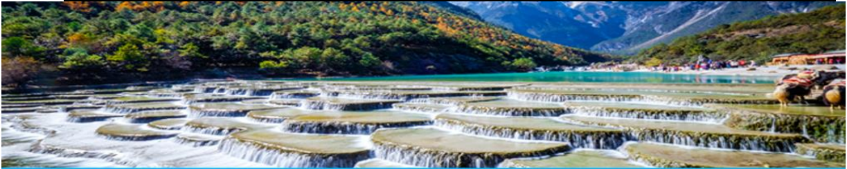
หุบเขาพระจันทร์สีน้ำเงิน Blue Moon Valley

หมายเหตุ กรณีที่กระเช้าใหญ่ขึ้นภูเขาหิมะมังกรหยกปิดให้บริการ ด้วยเหตุที่สภาพอากาศไม่เอื้ออำนวย หรือเป็นการปิดเพื่อตรวจสอบสภาพและซ่อมแซมประจำปี ทางทัวร์ขอสงวนสิทธิ์ที่จะจัดโปรแกรมขึ้นกระเช้า ที่จุดชมวิวภูเขาหิมะมังกรหยก ณ สถานีกระเช้าหุยนซานผิง แทน