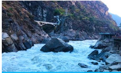
ช่องแคบเสือกระโจน

พักที่ DALI ZHUANGYUAN HOTEL ระดับ 4 ดาวหรือเทียบเท่าในเมืองต้าหลี่