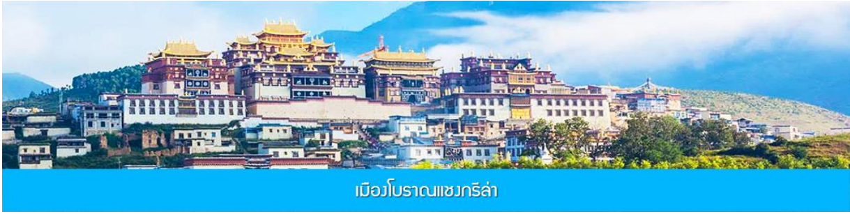
เมืองโบราณเขงกรี่ล่า

นำท่านเดินทางเที่ยวชม เมืองโบราณเขงกรี่ล่า เป็นศูนย์รวมของวัฒนธรรมชาวทิเบตลักษณะคล้าย ชุมชนเมืองโบราณทิเบตซึ่งเต็มไปด้วยร้านค้าของคนพื้นเมืองและร้านขายสินค้าที่ระลึกมากมาย