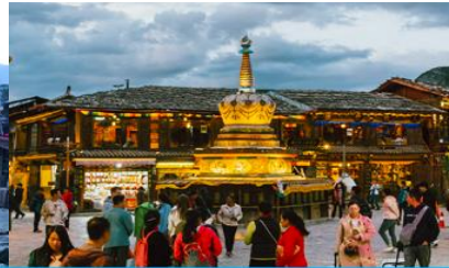
เมืองโบราณเซงกรี่ล่า