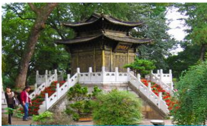
ตำหนักกวางจินเตียน

พักที่ JINHUA HOTEL ระดับ 4 ดาวหรือเทียบเท่าในเมืองคุนหมิง