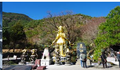
อุทยานน้ำหยก

วันที่ห้า กระจายขึ้นภูเขาหิมะมังกรหยก-หุบเขาพระจันทร์สีน้ำเงิน-โซ่ว THE IMPRESSION OF LIJIANG -อุทยานน้ำหยก - ศูนย์แพทย์แผนจีน - เมืองฉู่สง