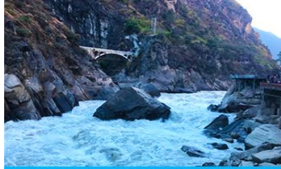
ช่องแคบเสื่อกระโจน

พักที่ DALI ZHUANGYUAN HOTEL ระดับ 4 ดาวหรือเทียบเท่าในเมืองต้าหลี่