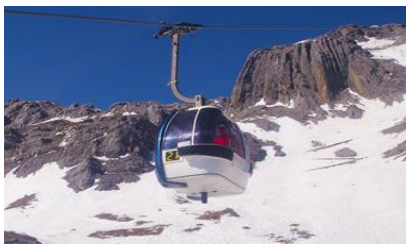
ภูเขาหิมะมังกรหยก (น้ำกระช้ำใหญ่)

ที่พัก FENG HUANG HOTEL ระดับ 4 ดาว หรือเทียบเท่าเมืองลี่เจียง