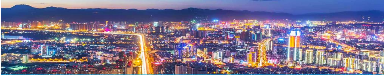
นครคุนหมิง