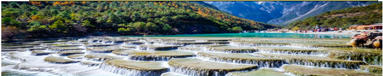
หุบเขาพระจันทร์สีน้ำเงิน Blue Moon Valley

หมายเหตุ กรณีที่กระเช้าใหญ่ขึ้นภูเขาหิมะมังกรหยกปิดให้บริการ ด้วยเหตุที่สภาพอากาศไม่เอื้ออำนวย หรือเป็นการปิดเพื่อตรวจสอบสภาพและซ่อมแซมประจำปี ทางทัวร์ขอสงวนสิทธิ์ที่จะจัดโปรแกรมขึ้นกระเช้า ที่จุดชมวิวภูเขาหิมะมังกรหยก ณ สถานีกระเช้าหุยนซานผิง แทน