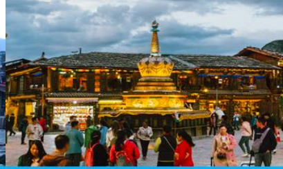
เมืองโบราณเซงกรีล่า

วันที่สาม เมืองต้าหลี่-ผ่านชมเจดีย์สามองค์-ช่องแคบเสื่อกระโจน – เมืองเซงกรีล่า-เมืองโบราณเซงกรีล่า