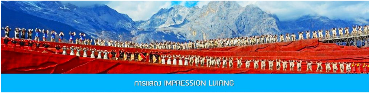
การแสดง IMPRESSION LIJIANG

***โปรดทราบ การแสดงนี้จัดขึ้นบริเวณลานกลางแจ้ง หากมีกรงดการแสดงในวันนั้นๆ ไม่ว่าจะด้วยสภาพอากาศหรือ กรณีอื่นใด ทำให้ไม่สามารถชมการแสดงได้ ผู้จัดสามารถจัดโชว์พื้นเมืองชุดอื่นมาทดแทนให้เท่านั้น โดยไม่มีการคืน ค่าบริการใดๆ ทั้งสิ้น ***