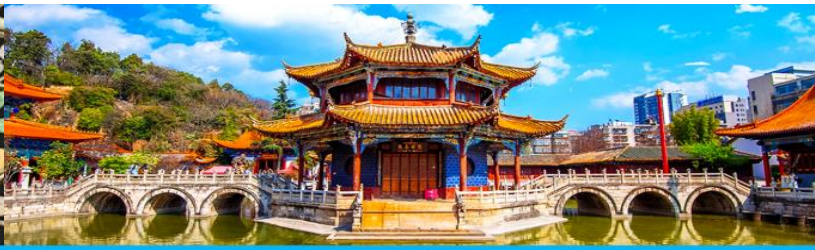
วัดหยวนกง