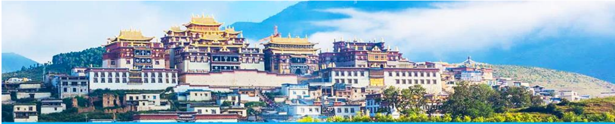
เมืองโบราณเขangkri-la

นำท่านเดินทางเที่ยวชม เมืองโบราณเขangkri-la เป็นศูนย์รวมของวัฒนธรรมชาวทิเบตลักษณะคล้ายชุมชนเมืองโบราณทิเบตซึ่งเต็มไปด้วยร้านค้าของคนพื้นเมืองและร้านขายสินค้าที่ระลึกมากมาย