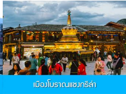
เมืองโบราณเซงกรี่ล่า

วันที่สาม เมืองต้าหลี่-ผ่านชมเจดีย์สามองค์-ช่องแคบเสื่อกระโจน – เมืองเซงกรี่ล่า-เมืองโบราณเซงกรี่ล่า