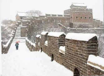
กำแพงเมืองจีน ด่านฉวิหยงกวน