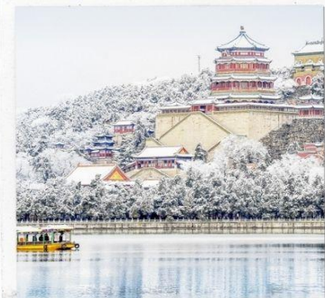
พระราชวังฤดูร้อน อวิเหอหยวน