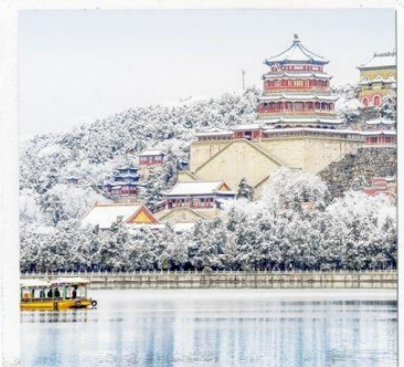
พระราชวังฤดูร้อน อวิเหอหยวน