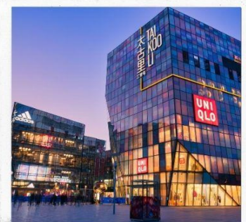
ชานหลี่ถุน