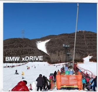
เล่นสกีจวินตุซาน