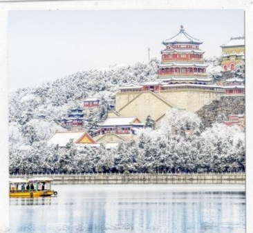
พระราชวังฤดูร้อน อวิเหอหยวน