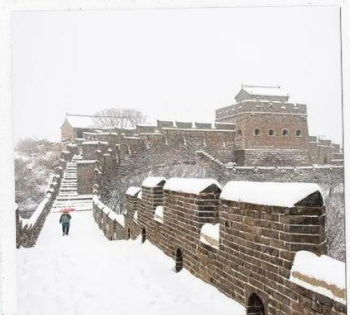
กำแพงเมืองจีน ด่านฉวิหยงกวน