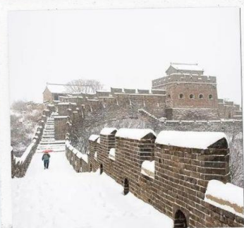
กำแพงเมืองจีน ด่านฉวิหยงกวน