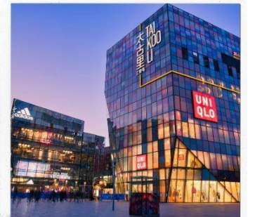
ซานหลี่เถิน