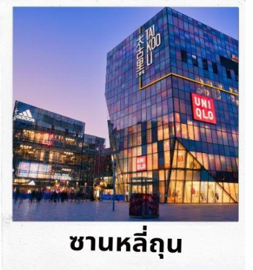
ซานหลี่เถิน