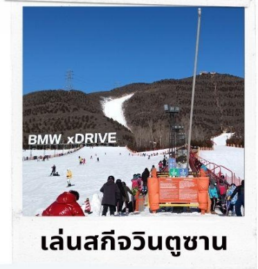
เล่นสกีจวินตุซาน