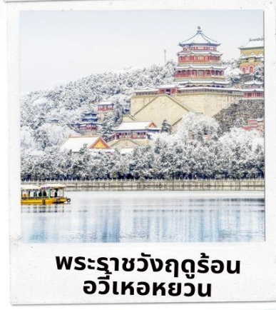
พระราชวังฤดูร้อน อวิเหอหยวน