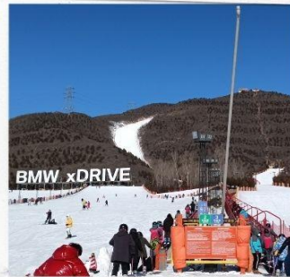
เล่นสกีจิวินตุซาน