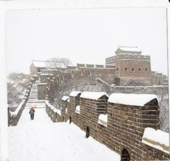
กำแพงเมืองจีน ด่านฉวิหยงกวน