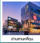
ย่านซานหลี่ถุน