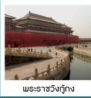
พระราชวังกุ้ง