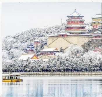
พระราชวังฤดูร้อน อวิเหอหยวน