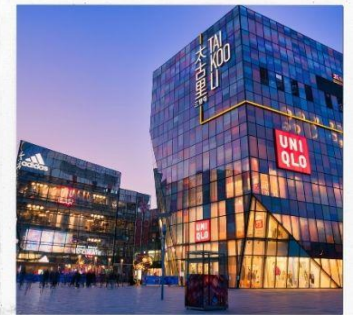
ชานหลี่ถุน