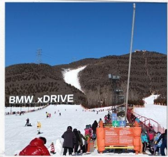
เล่นสกีจวินตุซาน