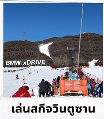
เล่นสกีจวินตุซาน