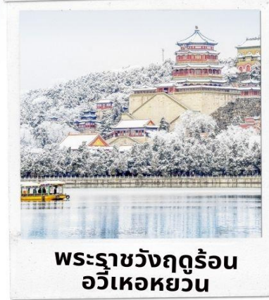
พระราชวังฤดูร้อน อวิเหอหยวน