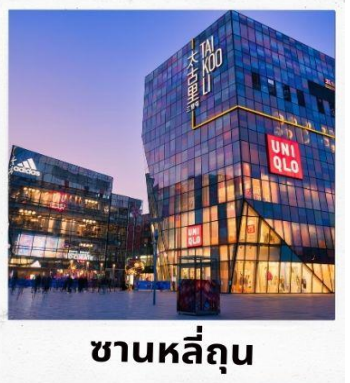
ซานหลี่เถิน