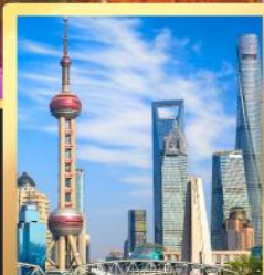
เซี่ยงไฮ้