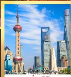
เซี่ยงไฮ้