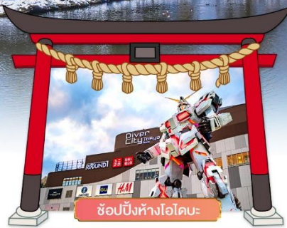
ซ็อบบิงห้างไอโดบะ