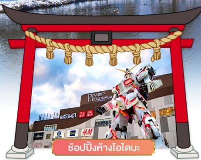
ช้อปปิ้งห้างไอโดบะ