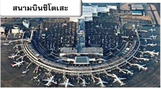
สนามบินชิโตเสะ

จากนั้นนำท่านออกเดินทางสู่ สนามบินคันไซ เพื่อเดินทางไปยัง สนามบินชิโตเสะ ฮอกไกโด