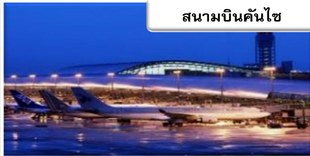
สนามบินคันไซ

เวลา 00.55 น. ออกเดินทางสู่ สนามบินคันไซ ประเทศญี่ปุ่น โดยสายการบินเจแปนแอร์ไลน์ เที่ยวบินที่ JL 728