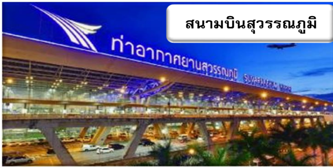
สนามบินสุวรรณภูมิ

เวลา 22.00 น. พร้อมกันที่ สนามบินสุวรรณภูมิ อาคารผู้โดยสารขาออกระหว่างประเทศ เคาน์เตอร์ P สายการบิน เจแปนแอร์ไลน์ เจ้าหน้าที่คอยให้การต้อนรับ ดูแลด้านเอกสาร เช็คอิน และสัมภาระในการเดินทาง