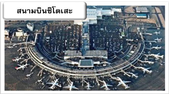
สนามบินชิโตเสะ

จากนั้นนำท่านออกเดินทางสู่ สนามบินคันไซ เพื่อเดินทางไปยัง สนามบินชิโตเสะ ฮอกไกโด