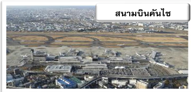
สนามบินคันไซ

จากนั้นนำท่านออกเดินทางสู่ สนามบินคันไซ เพื่อเดินทางไปยัง สนามบินชิโตเสะ ฮอกไกโด