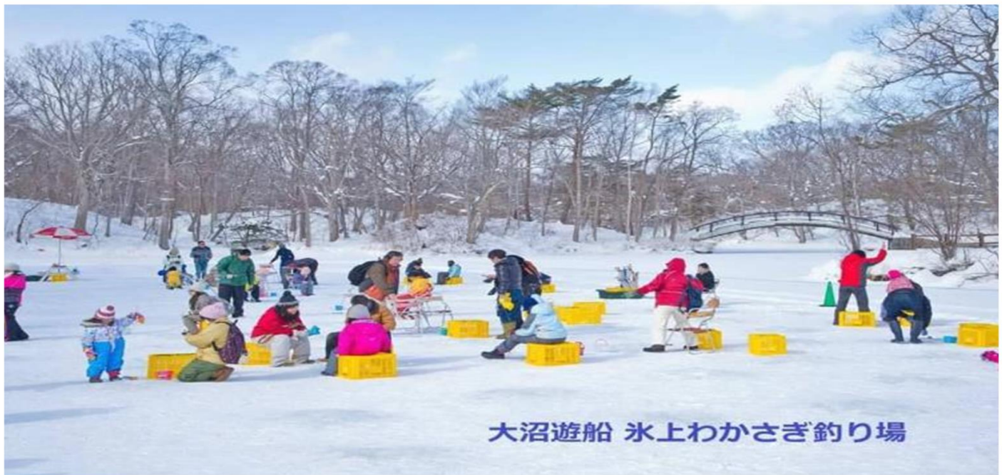
大沼遊船 氷上わかさぎ釣り場