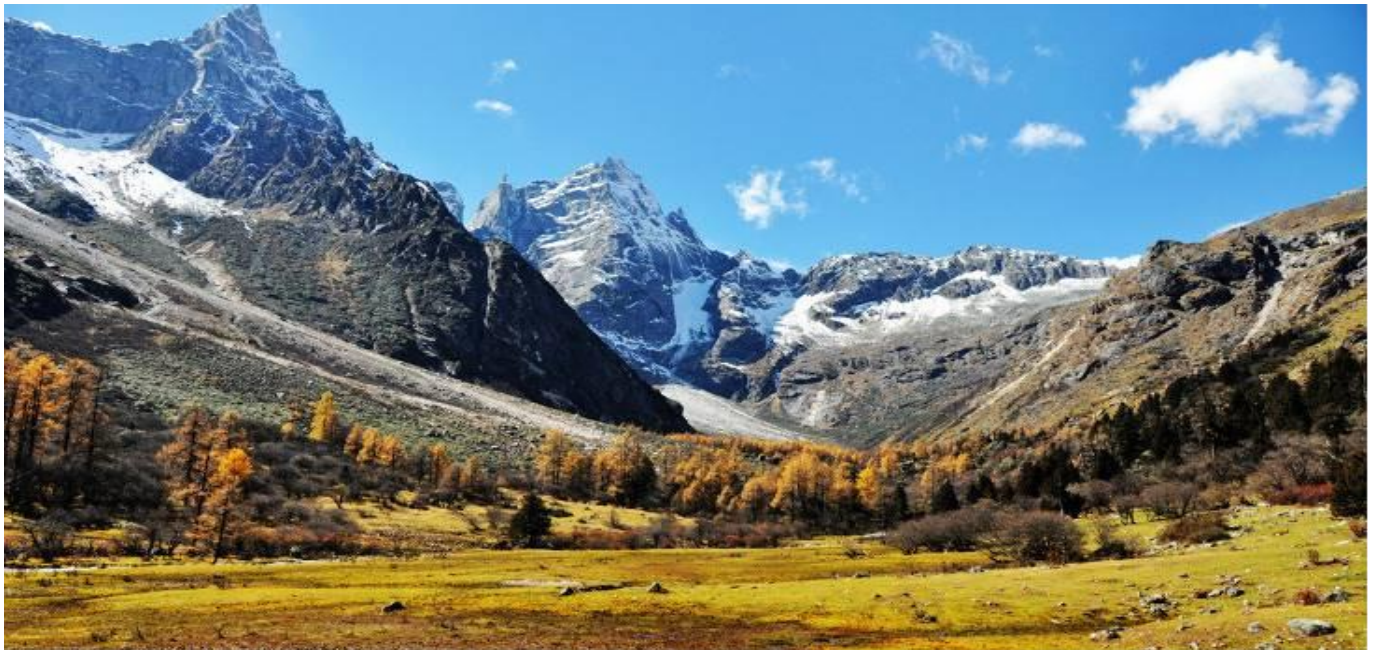
GO1TFU-TG012 เฉิงตู หวงหลง จิวจ้ายโกว ภูเขาซีดรุณี 6วัน 5คืน โดยสายการบิน Thai Airway (TG)

จากนั้นนำท่านเดินทางสู่ ภูเขาซีดรุณี(รวมรถอุทยาน) “ซีดรุณี” หรือ ชื่อภูเขาหนึ่งยงชาน ตั้งอยู่ในมณฑลเสฉวน ประเทศจีน เป็นยอดเขา 4 ลูกที่เรียงรายติดต่อกันไปจากทิศเหนือถึงทิศใต้เป็นระยะทาง 3.5 กิโลเมตร โดยมีความสูงเหนือระดับน้ำทะเลแบ่งเป็น 6,250 เมตร/ 5,664 เมตร/ 5,454 เมตร และ 5,355 เมตร บนยอดเขาทั้ง 4 แห่งนี้จะมีหิมะปกคลุมตลอดทั้งปี ทำให้ดูเหมือนส่วนศีรษะที่คลุมด้วยผ้าสีขาวของหญิงสาว 4 คน จึงเป็นที่มาของชื่อ “ภูเขาซีดรุณี” นั่นเองพื้นที่บริเวณภูเขาซีดรุณีนั้นเป็นพื้นที่ชั้นหินแบบยุคโบราณ, เพราะเหตุผลที่ว่า ยอดเขามีลักษณะแปลกที่พบเห็นได้น้อย, บนยอดเขามีหิมะปกคลุมตลอดปี, ทำให้ได้รับฉายาว่า “ราชินีแห่งดินแดนเสฉวน” หรือ “ภูเขาศักดิ์สิทธิ์แห่งดินแดนทางทิศตะวันออก” มียอดเขาที่มีระดับความสูงน้ำทะเลสูงเกิน 5000 เมตร ถึง 61 ลูก, รอยต่อระหว่างภูเขามียอดบึงทะเลสาบอยู่ถึง 25 แห่ง มีน้ำตกอยู่ 120 กว่าแห่ง