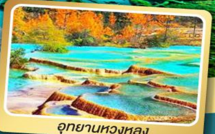
อุทยานหองหลง