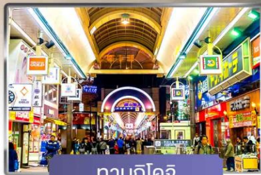
ทานุกิโคจิ