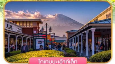
โกเทมบะเอ้าท์เล็ต