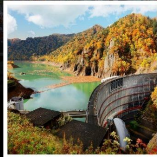
สันเขื่อนโอเฮเคียว