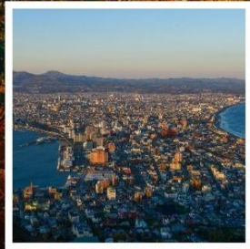
กระเช้าภูเขาฮาโกดาเตะ