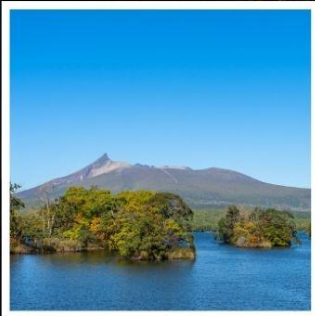
อุทยานแห่งชาติโอโนมะ