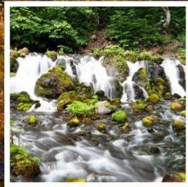
สวนฟูจิตาชิพาร์ค