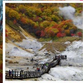
หุบเขานรก จิโคะคุดาบิ