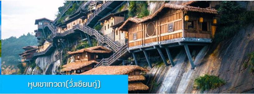
หุบเขาเทวดา(วังเซียนถู่)