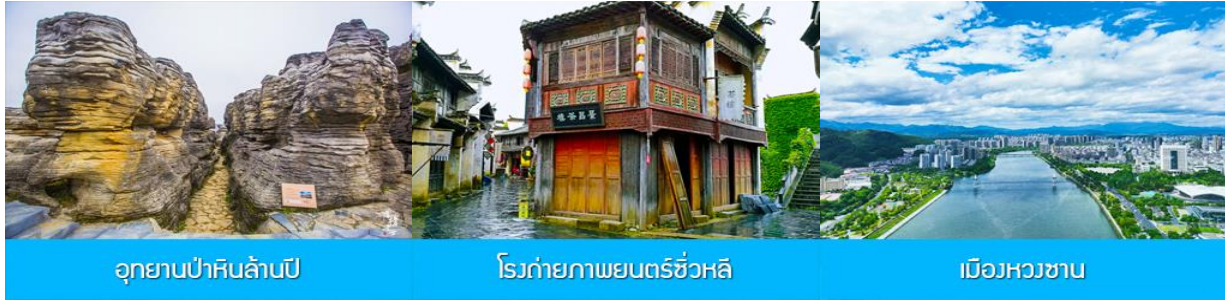
อุทยานป่าหินล้านปี