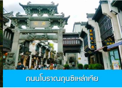
ถนนโบราณฉุนซีเหล่าเจีย