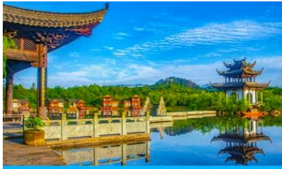
หมู่บ้านโบราณ สู่มีว้ซังเหอ