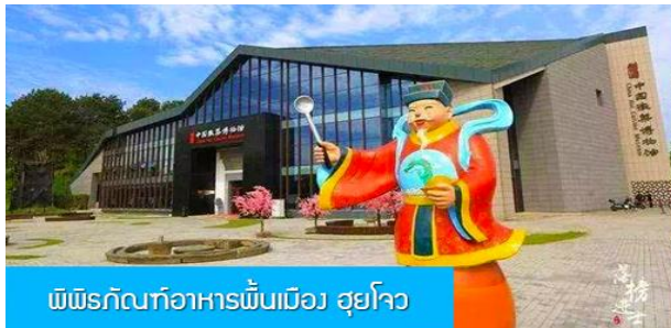
พิพิธภัณฑ์อาหารพื้นเมือง สุยโจว

เที่ยง อิสระอาหารมื้อกลางวัน ( ท่านสามารถเลือกชิมอาหารพื้นเมืองในระแวกโรงแรมได้ตามอัชชาศัย )