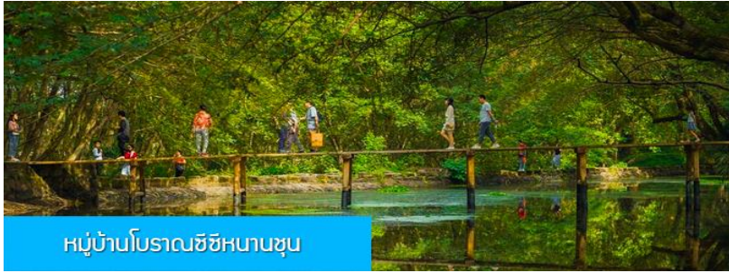
หมู่บ้านโบราณซีซีหนานซุน