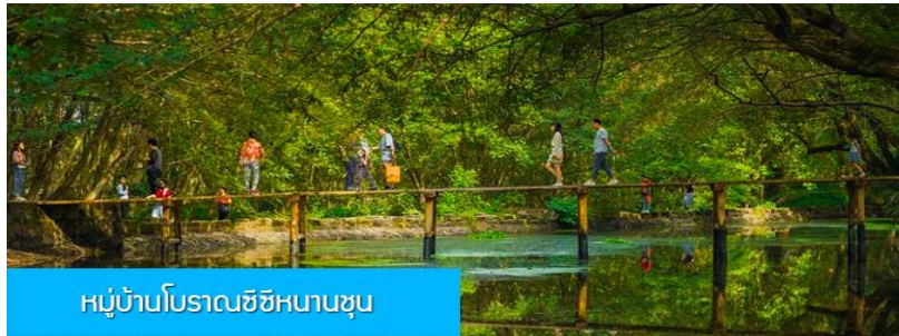
หมู่บ้านโบราณซีซีหนานซุน