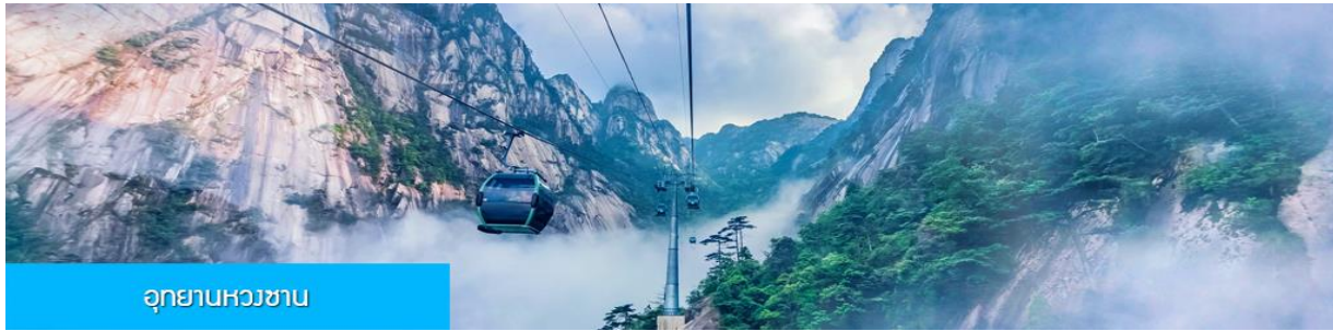
อุทยานหวงซาน

วันที่ห้า เมืองหวงซาน –พักผ่อนตามอัชยาศัยในโรงแรม หรือท่านสามารถซื้อโปรแกรมทัวร์เสริมเที่ยวเขาหวงซาน – พิพิธภัณฑ์อาหารพื้นเมือง