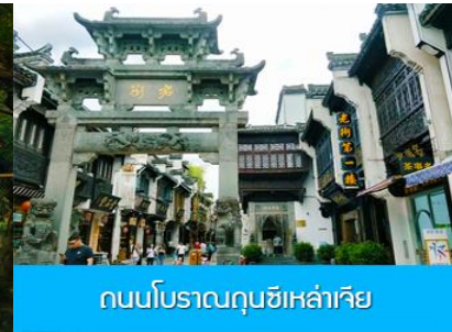
ถนนโบราณกุนซีเหล่าเจีย

วันที่หก เมืองหวงซาน –หมู่บ้านโบราณซีซีหนานซุน –อิสระ ณ ถนนโบราณกุนซีและย่านศูนย์การค้า – เดินทางกลับกรุงเทพฯ