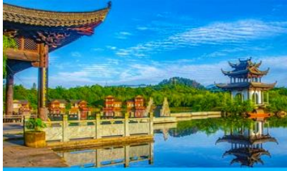
หมู่บ้านโบราณ สู่มีวี่ซังเหอ