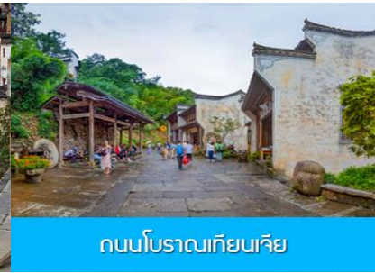
ถนนโบราณเทียนเจีย