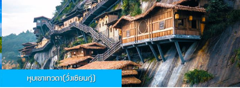
หุบเขาเทวดา(วังเซียนถู่)