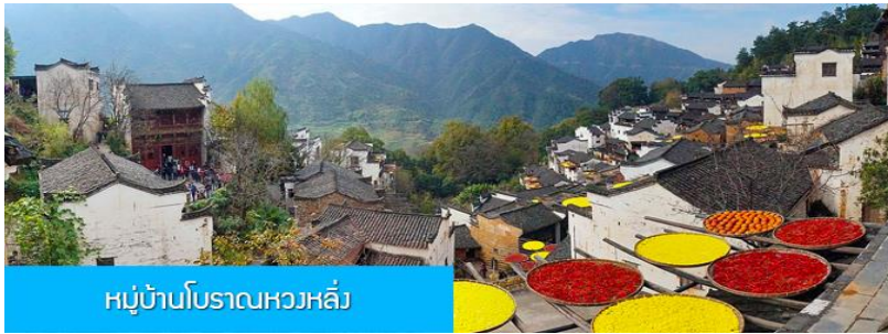
หมู่บ้านโบราณหวงหลิ่ง