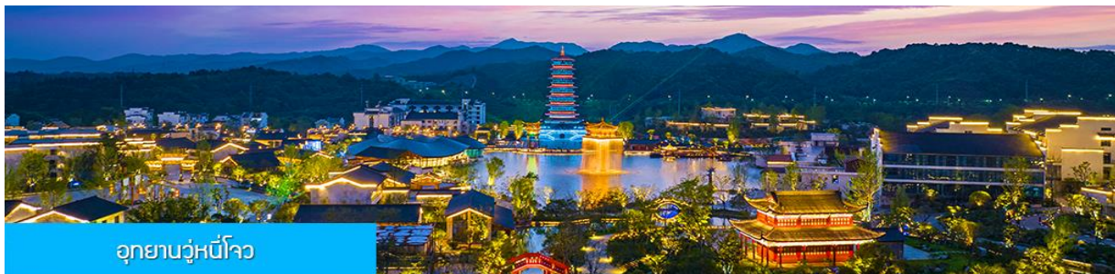
อุทยานวู่หนี่โจว