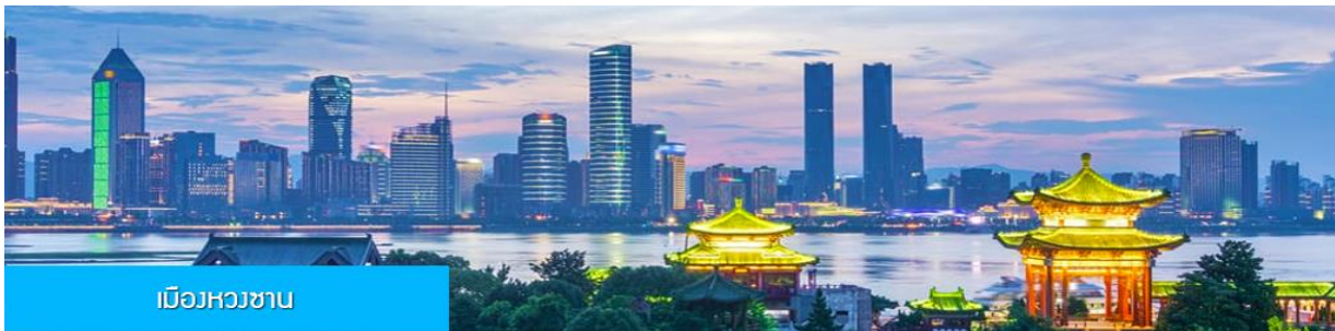
เมืองหวงซาน