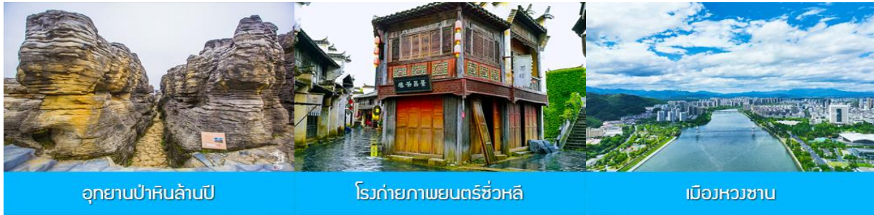
อุทยานปาหินล้านปี