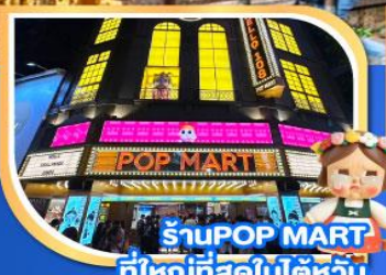
ร้าน POP MART ที่ใหญ่ที่สุดในโลกไต้หวัน